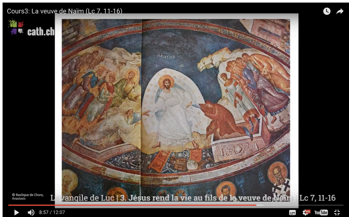
Anastasis, basilique de Chora